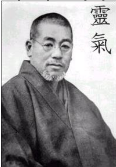
Микао Усуи и написание " Рэйки " в старояпонском стиле

И еще Франк А. Петтер включил в книгу собственное понимание различных предметов и тем, рассмотренных через призму независимого мастера Рэйки .